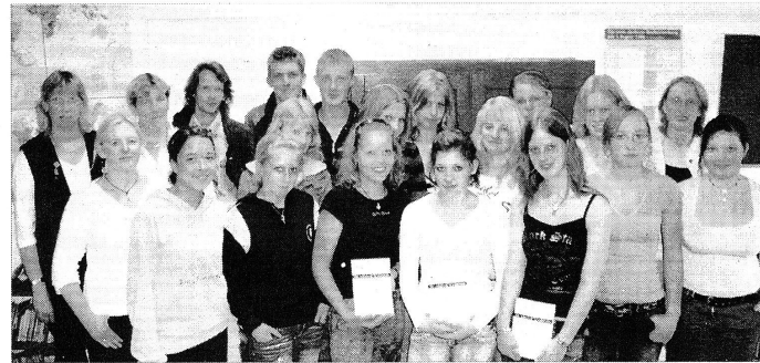
Die Großheider Schülerinnen und Schüler und ihre Helfer sind stolz auf das erfolgreiche Übersetzungsprojekt.